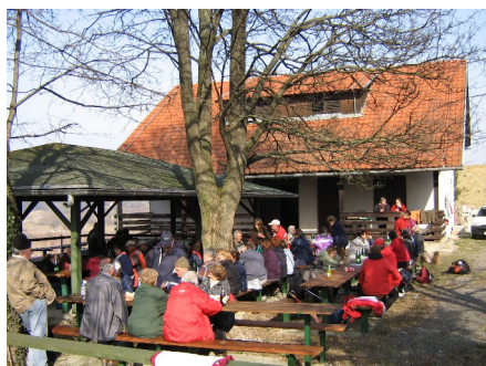
Lovački dom "Jelen"