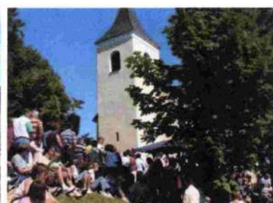
Sv. Augustin - Haloze