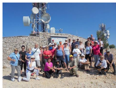
Brač - Vidova gora