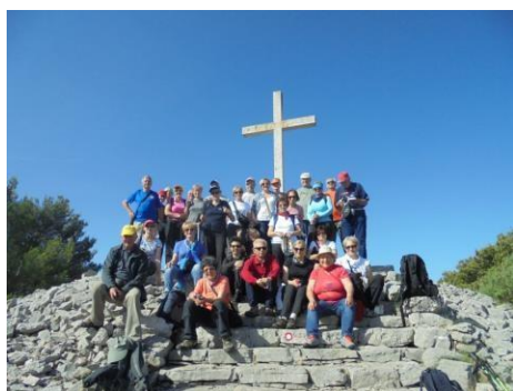
Vrh Šolte - Vela Straža