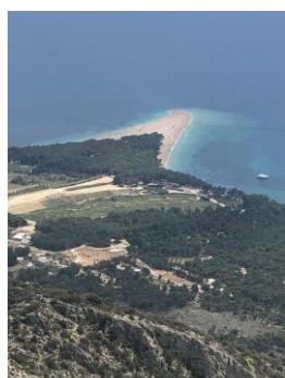
Brač - Bol