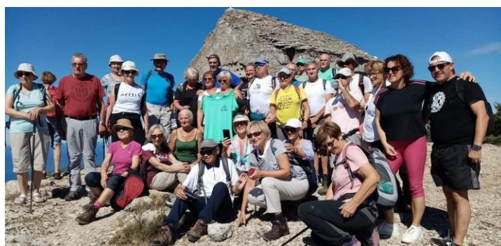
Vrh VIS -a - HUM