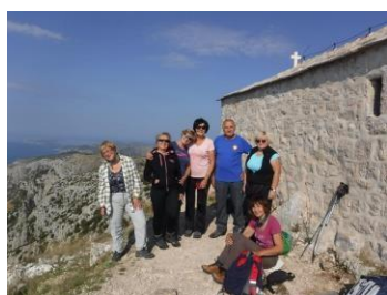
Na vrhu Hvara - Sv. Nikola