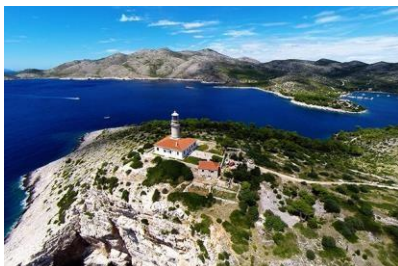
Vrh Lastova - Sozanj