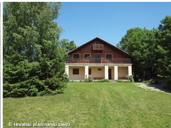
Planinarski dom na Kladeščici