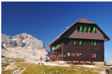
dom Valentina Staniča pod Triglavom (2332m)