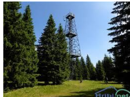
Razgledna piramida na vrhu

POLAZAK: 13.08.2023. u 7,00 h sa parkirališta na varaždinskom groblju