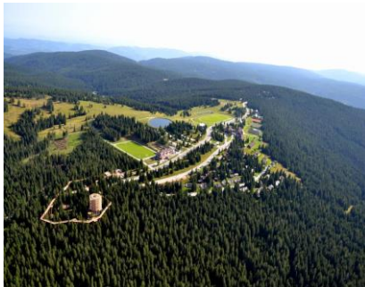
R o g l a