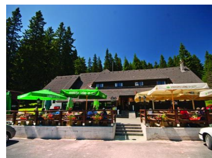
Planinarska kuća na Peseku