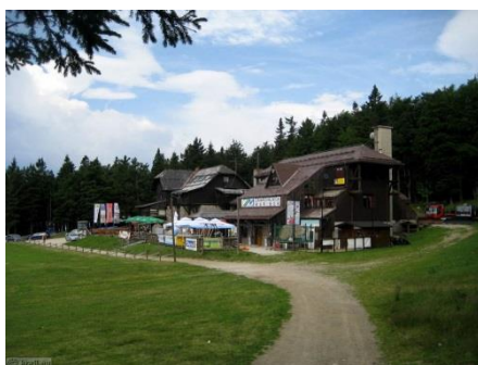
Gomniškov dom bez snijega