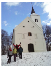
Sv Tri kralja