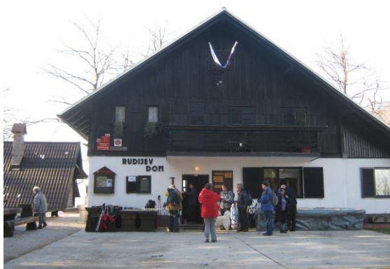
Planinarski dom na Donačkoj