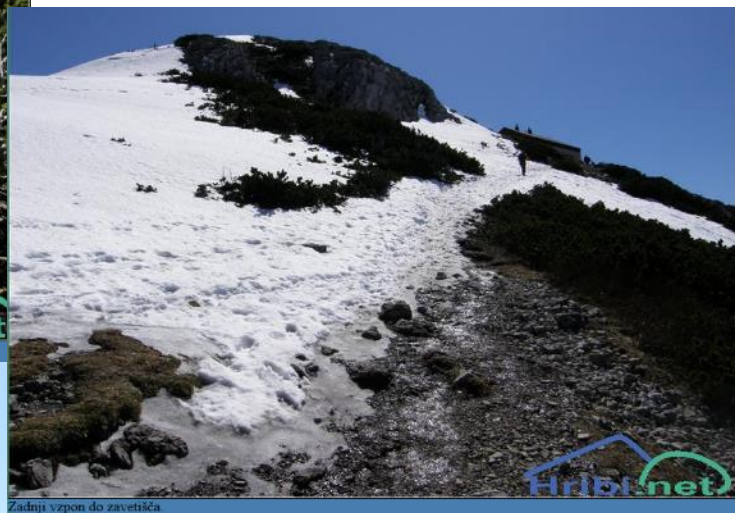
Zadnji vzpon do zavetišča