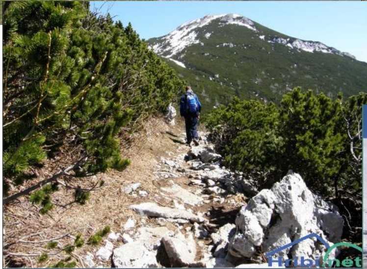
Pot na Snežnik.