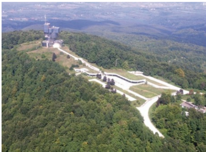
Vrh Veliki Petrovac 512 m Šetnice kroz šume bukve

VREMENIK: Polazak 11.7.2021. u 7 h, ispred hotela Turist, a povratak do 20:30 h.