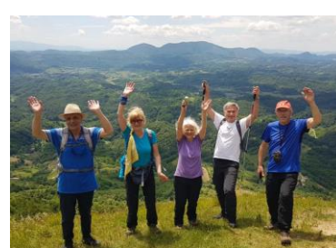
Pozdrav sa Ravne gore