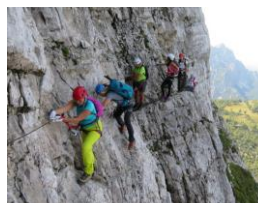
U stijeni Mojstrovke