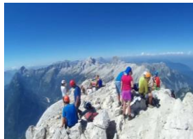
Na vrhu Prisojnika