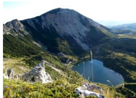
Šatorsko jezero BiH