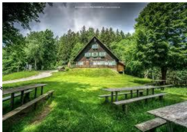
Koča na Žavcarjevem vrhu 863 mnv

POLAZAK: 31.03.2019.u 7,00 h ispred hotela “Turist”