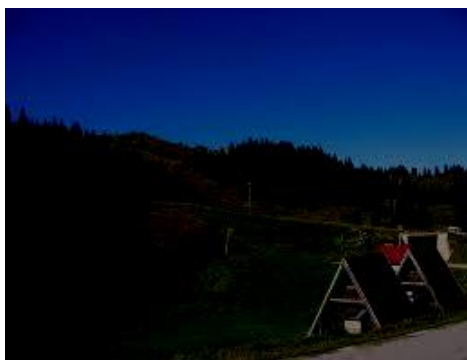
Jahorina 1.916 mnv