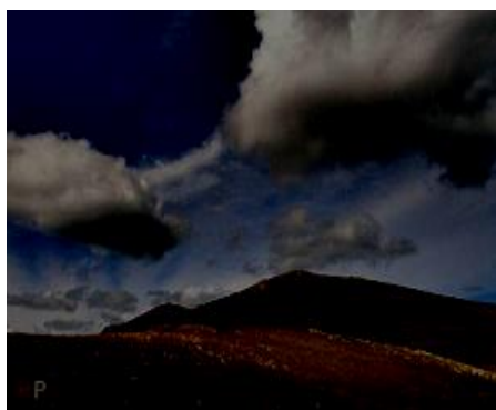
Idovac 1.956 mnv