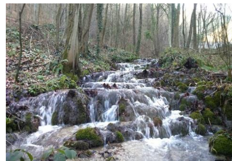
Slap potoka Šumi