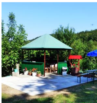
Sjenica izletišta Jarki