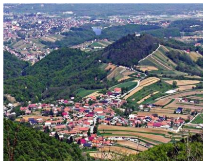
Prigorec kod Ivanca