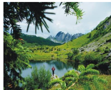
Jezero Gornje Bare