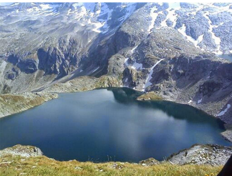
Schmalzscharte Pogled na jezero