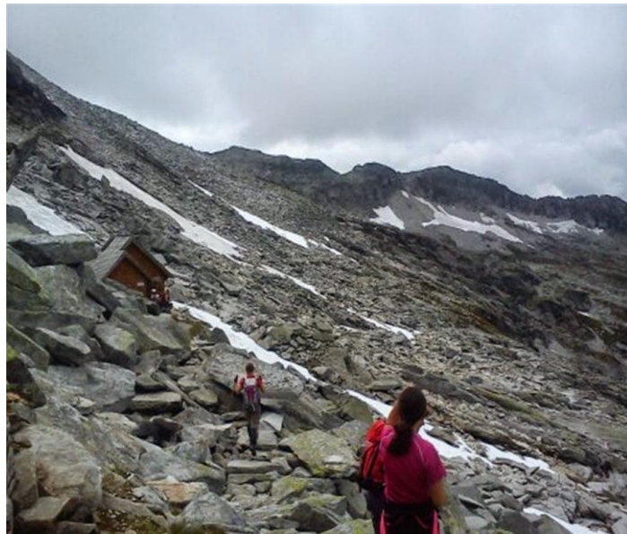
Bivak na 2240 m

ZAHTJEVNOST: Staze spadaju u nezahtjevne planinarske ture, ali je potrebna kondicija za Schmalzscharte i Weiseck